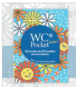
Sachet refermable de 10 WC Pocket Kids au design dédié aux enfants.

En vacances, en déplacement, au bureau, au restaurant, à l'école, etc... plus la peine de se retenir ni d'adopter des positions acrobatiques, grâce aux WC Pockets .