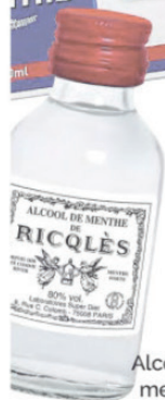
Alcool de menthe Ricqlès, 7,60 € en pharmacie.