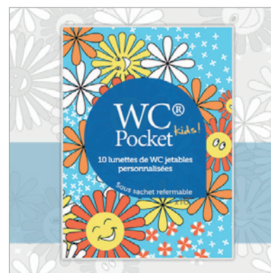
Sachet refermable de 10 WC Pocket Kids au design dédié aux enfants.